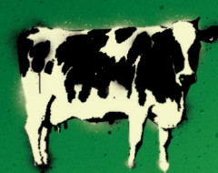
1 kg Rindfleisch: 50,8 km

Durch einen Veggieday pro Woche kann jede/r von uns aktiv zum Schutz unseres Klimas beitragen.