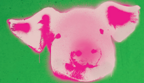
1 kg Schweinefleisch: 25,8 km

Klimabilanz dargestellt in Autokilometern